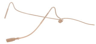
Umbau von 3-Pol-HSE-Kopfbügelmikrofonen zum Anschluss an JTS-Taschensender Reconfiguration of 3-pole HSE headset mics for the connection to JTS pocket transmitters

MONACOR INTERNATIONAL GmbH & Co. KG Konsul-Smidt-Str. 68 28217 Bremen Deutschland info@monacor.de