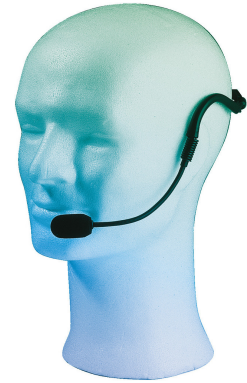
Umbau von 3-Pol-HSE-Kopfbügelmikrofonen zum Anschluss an JTS-Taschensender Reconfiguration of 3-pole HSE headset mic for the connection to JTS pocket transmitters